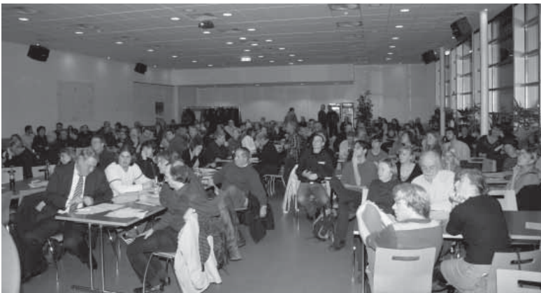
Gründungsversammlung der BI für das Bürgerbegehren am 20.11. 2007“

Der Musikhallenverein ist deshalb sehr bemüht, vom Image eines Luxusprojektes loszukommen. Die neue Halle in Coesfeld, die „nur“ 16 Mio. € gekostet haben soll, wird als Vorbild ins Spiel gebracht. Der Vergleich hinkt natürlich schon deshalb, weil die Coesfelder sich mit rd. 650 Sitzplätzen (keine Stehplätze!) zufrieden gegeben haben. In Coesfeld wurde die Halle auch wirklich privat finanziert. In Münster sollen es aber nach wie vor bis zu 1.600 Plätze sein, weil sonst die Spitzenensembles nicht nach Münster kommen würden.